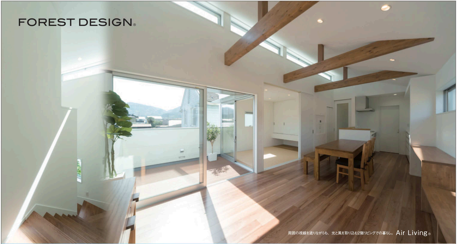
周囲の視線を遮りながらも、光と風を取り込む2階リビングでの暮らし。Air Living®