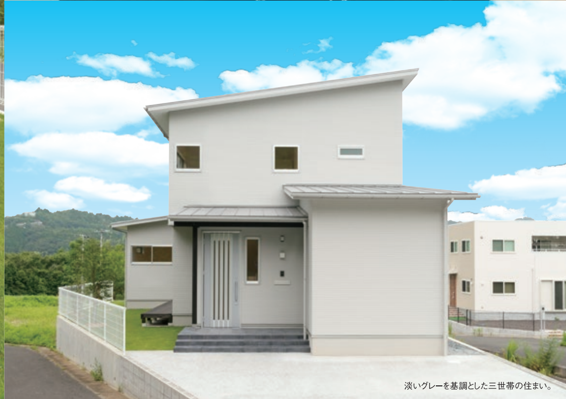
淡いグレーを基調とした三世帯の住まい。