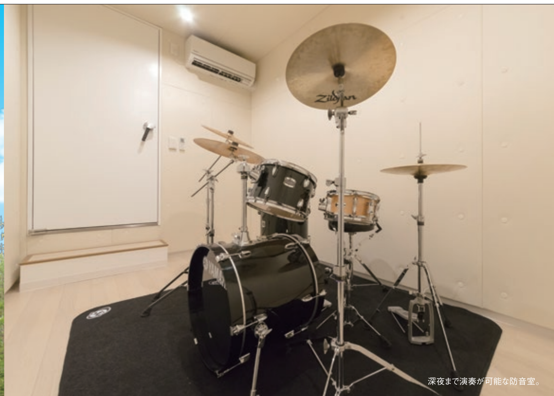
深夜まで演奏が可能な防音室。