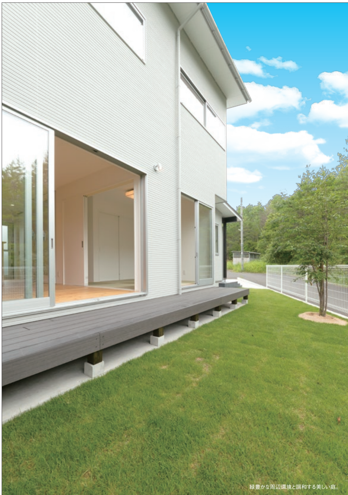
緑豊かな周辺環境と調和する美しい庭。